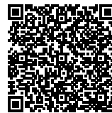
PUTU NUGROHO WISNU BROTO Asesor Kompetensi